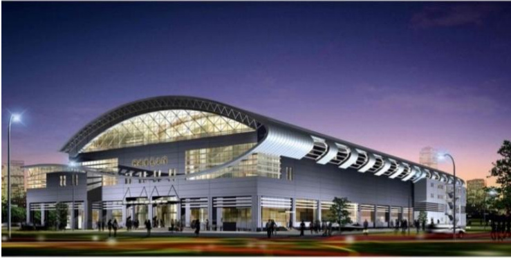
北京体育大学网球馆