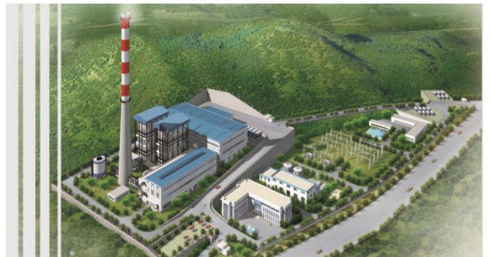
福建凯圣生物质发电工程