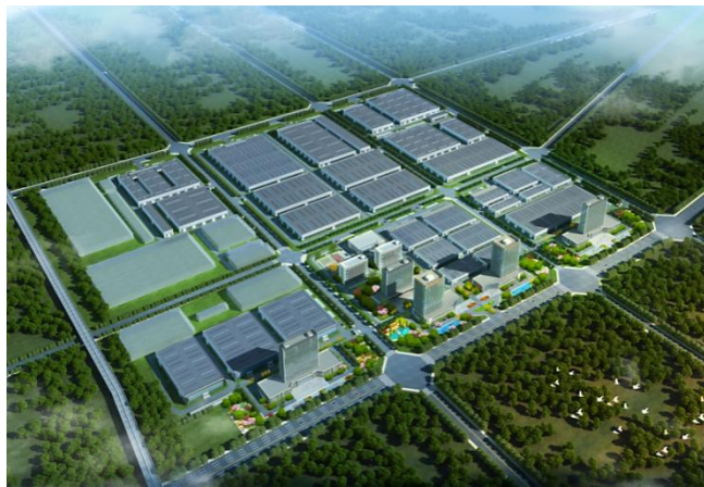
济宁先进制造产业园