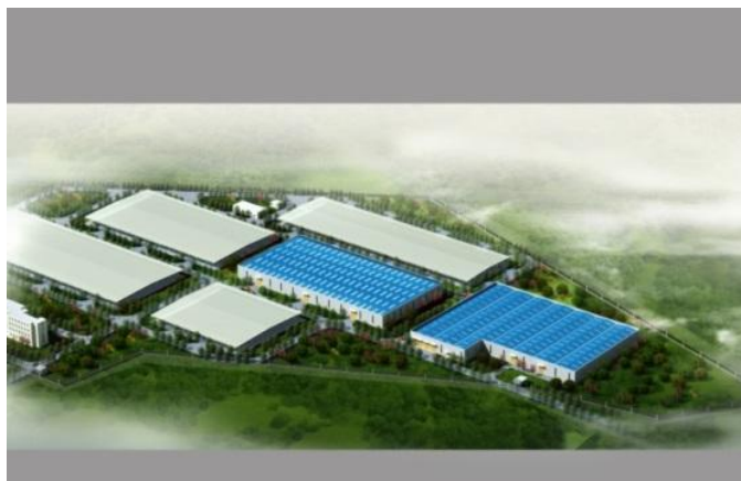
洛阳污泥堆肥处置工程（328t/d）