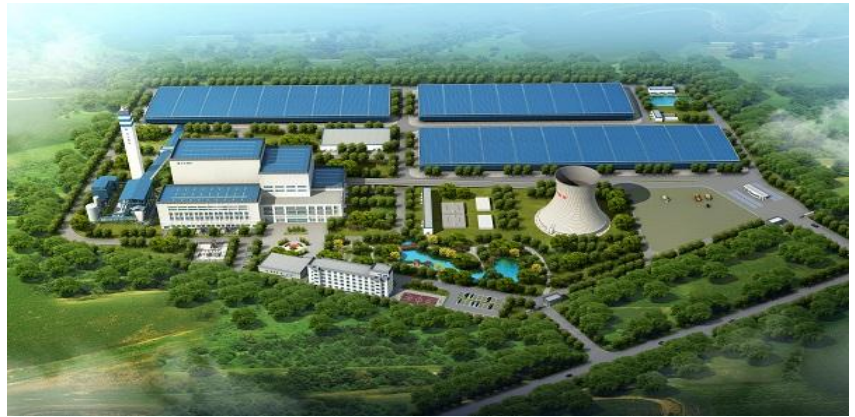
萧县光大生活垃圾焚烧 发电及生物质发电一体化