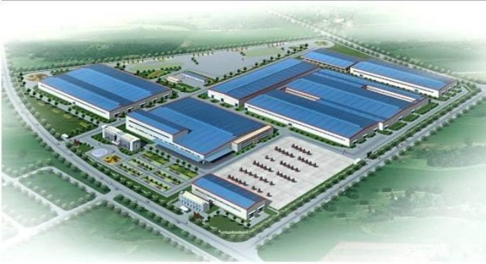
安徽合力叉车项目