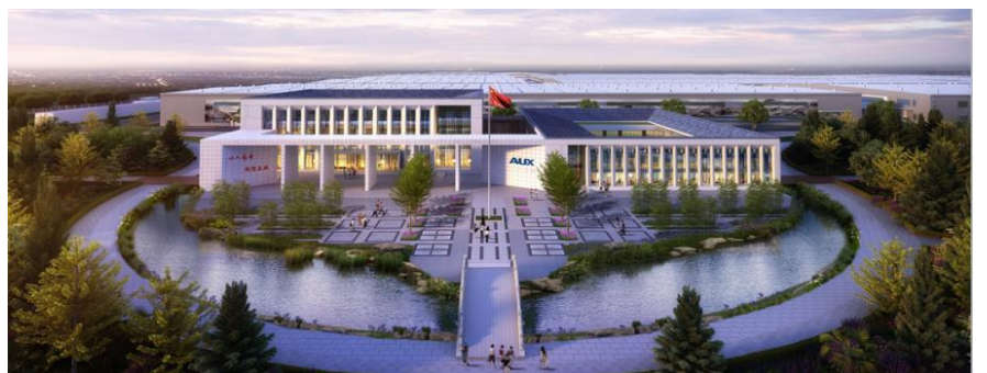
奥克斯马鞍山 智能家电产业园