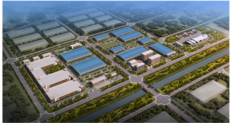
锦州沃特玛新能源汽车产业 创新联盟产业园（一期）项目