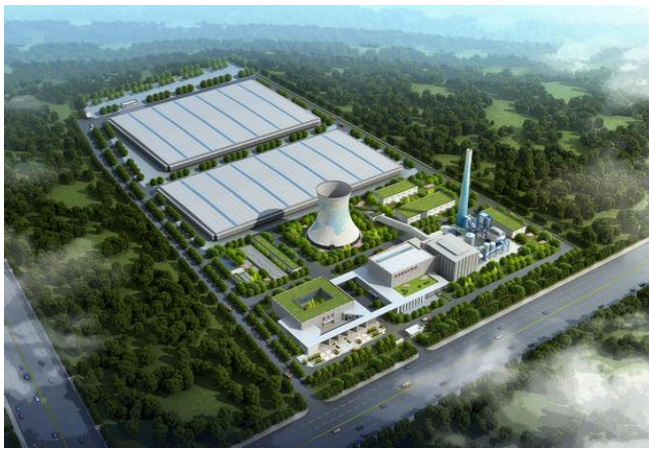
中法合资的第一个生物质热电 联产项目（法电灵宝）