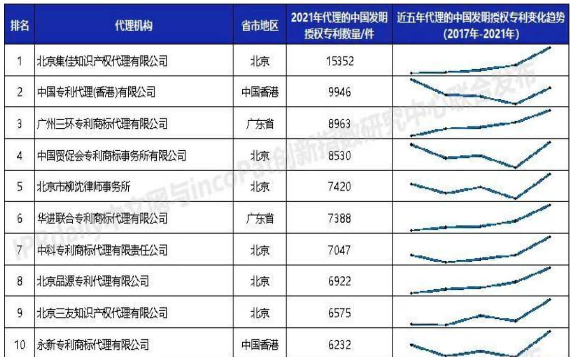
表 1. 2021 年国内代理所发明授权数量 TOP3：

从 2021 年专利公开数据中，数据提取截止时间 2021.1.1-2021.12.31，如下表 1 所示，三环专利 2021 年国内发明授权量全国第三，行业排名稳定前三，专利授权数量较 2020 年高基数基础上增加了 44%，近五年代理的中国发明授权专利数量呈稳步上升趋势。